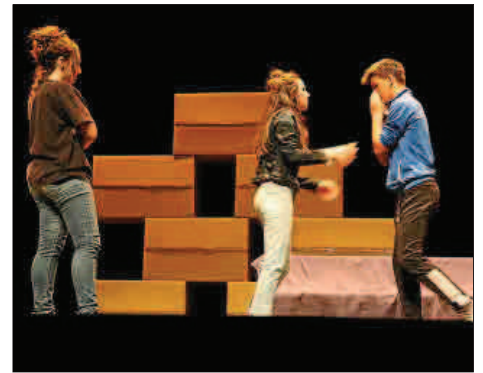
Una escena de la representación de 'Ho sento', en el Teatro Valle-Inclán, de Madrid.

Escola Teatre Educatiu de Mallorca ha estado durante una semana en Madrid participando en el campus de los Premios