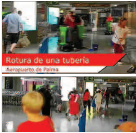
Fotogramas del vídeo colgado ayer en ultimahora.es con la tubería rota en primer plano.