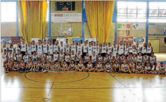
Los participantes en el Campus de Joan Sastre, ayer, en el pabellón de Alcúdia.