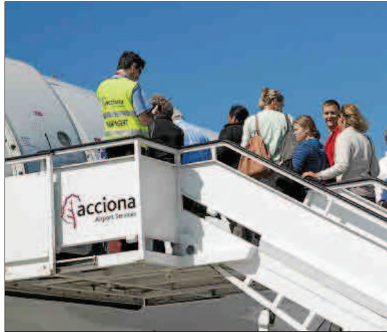
En los aeropuertos baleares trabajan más de 3.000 personas en el 'handling'.

► Son Sant Joan, Maó y Eivissa quedarán bloqueados por la falta de servicio en tierra a aviones y pasajeros de todas las compañías aéreas